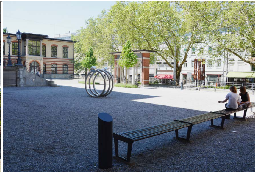
Oben: CAB Kiesplatz links Rampe Unten: CAB Kiesplatz rechts