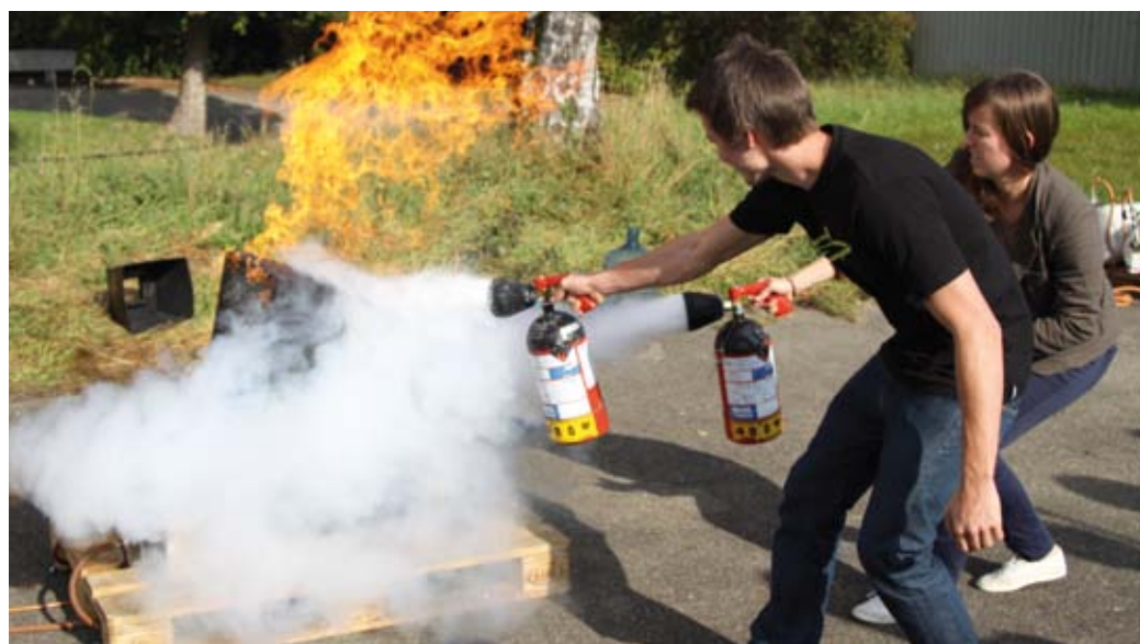
Im Brandschutzkurs lernen ETH-Angehörige, wie sie einen Brand rasch und sicher löschen können.

Melden Sie sich auf > www.sicherheit.ethz.ch unter «Dienstleistungen/Brandschutz/Brandschutzkurs» an. Für weitere Auskünfte oder Gruppenanmeldungen steht Ihnen das Sekretariat der SGU (Tel. 044 632 30 30) zur Verfügung. (mf)