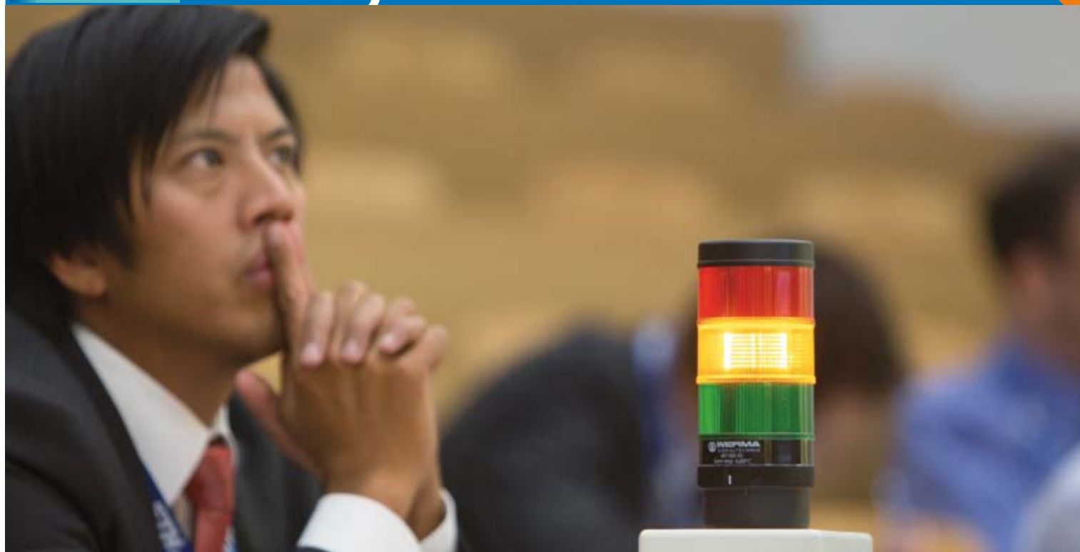
Wenn die Ampel auf Rot umstellt, bricht die Redezeit der Forschenden ab, und es beginnt die Diskussion mit der Industrie. Innovativ sind am Industry Day nicht nur die Projekte, sondern auch der Anlass selbst.