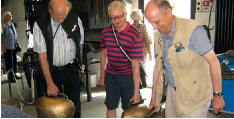
In der Klangschmiede in Alt St. Johann entwickeln Klänge mitunter ein Eigenleben.

Das Sommerwanderprogramm der ETH-Pensionierten-Vereinigung (PVETH) hatte es in sich: Im Juni besuchten die Pensionierten den Jura und den Schweizerweg von Flüelen nach Bauen UR. Im Juragebiet war Alltreu SO das Ziel: Im bekannten «Storchendorf» sind in diesem Jahr 70 Jungstörchen geschlüpft – so viele wie noch nie in der jüngeren Dorfgeschichte. Im Juli führten die Wanderungen auf den Flumserberg SG sowie auf dem Barfussweg rund um den Härzlisee bei Engelberg OW. Auf diesem Weg geht man auf Unterlagen wie Sand, Holzschnitzel, Kiesel, Lehm und Wasser.