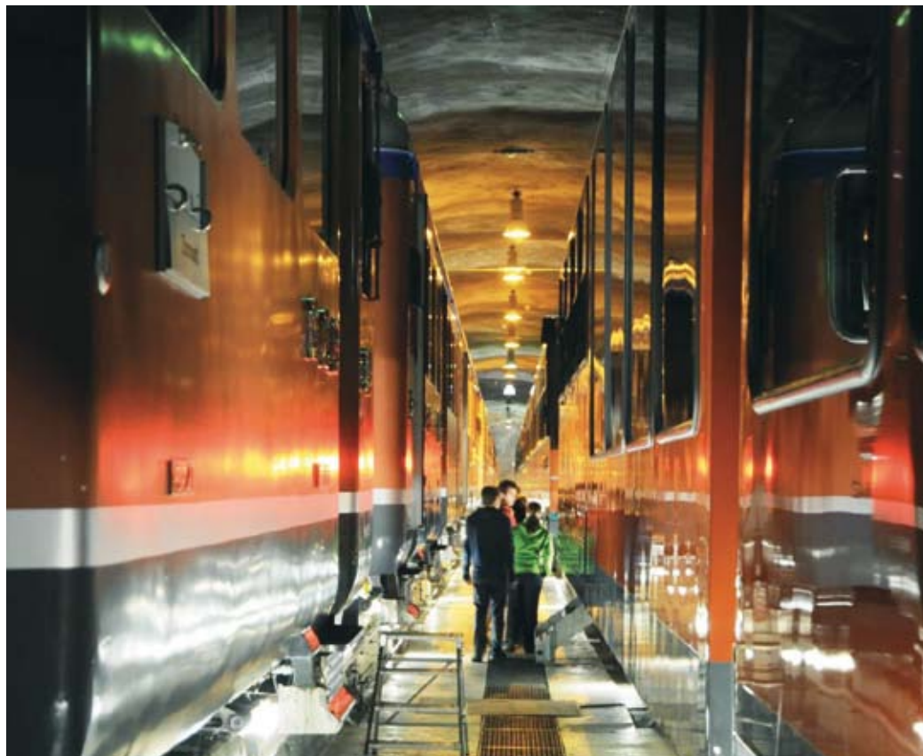
Die Gornergratbahn ist eine bahntechnische Rarität: Im Depot in Zermatt erfahren Studierende der ETH, wie Drehstromantriebe in der Praxis funktionieren.