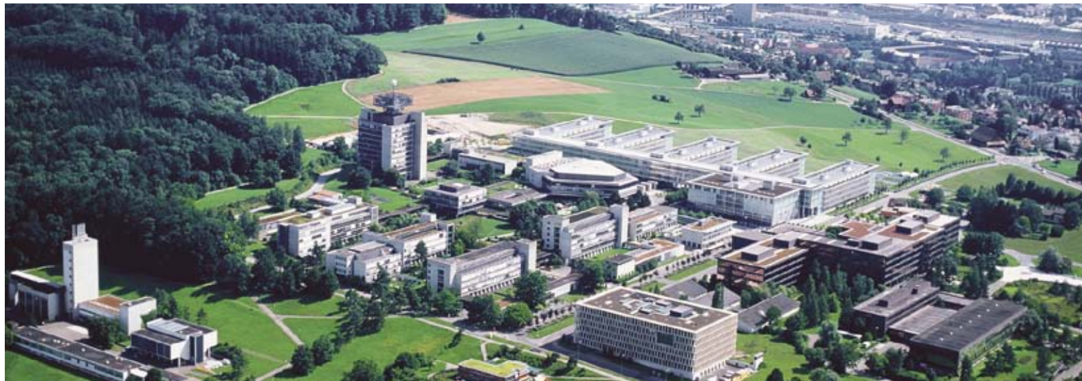
Due to the rising number of students and staff over the next years the canteens will be renovated and extended.