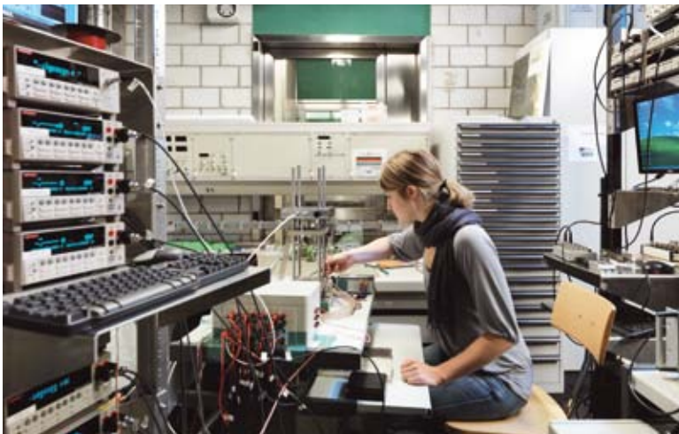
Forschen im Labor für Mikro- und Nanosysteme (D-MAVT). Die ETH beteiligt sich bis 2015 am Femtec-Careerbuliding-Programm. Femtec ist ein im Jahr 2003 initiiertes Hochschul-Karrierezentrum für Frauen in den Ingenieur- und Naturwissenschaften.

Seit 2006 nimmt die ETH Zürich am Femtec-Careerbuilding-Programm teil. Die Erfahrungen waren durchwegs positiv. Die Schulleitung hat darum beschlossen, sich für weitere drei Jahre bis Ende 2015 am Förderprogramm zu beteiligen.